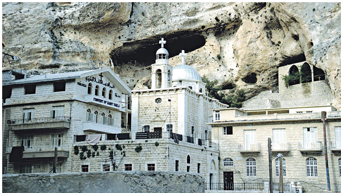
Das Theklakloster in Syrien, das durch seine spektakuläre Lage die Besucher/innen staunen lässt HOLLERWEGER